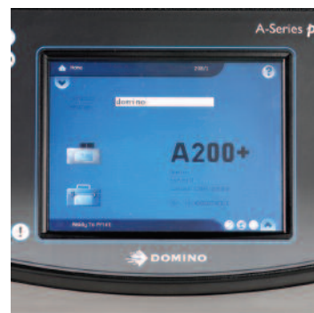
Commande par écran tactile en option