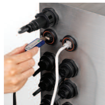
Ports Ethernet et USB en standard